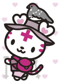
長野県限定 ハートラちゃん

今年度は「ご当地ハートラちゃん」の発表もあり、日本各地の多様な魅力とともに、赤十字の活動が全国に広がっていることが印象的でした。