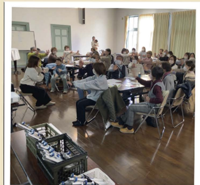
第1弾の体験講座の様子

新潟県出身、長野市在住。 音楽と福祉に興味があり音楽療法士を目指す。 介護士や専門学校教員を経て、音楽療法士として活動。 モットーは参加者の想いや笑顔を大切に活動すること。