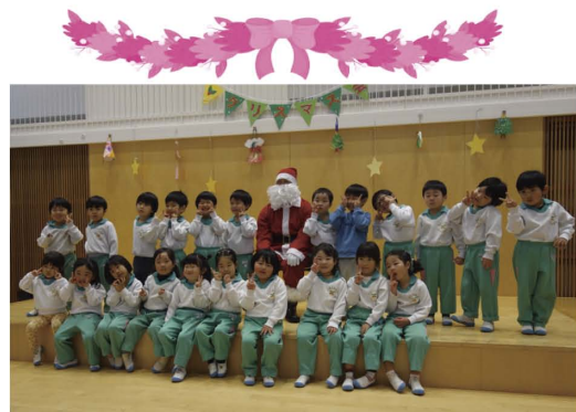
サンタさんと園児たちで記念撮影！

「サンタさんはどこから来 たの」「どうしてプレゼントを 配っているの」などの質問に 「サンタさんは寒い国から来 たんだよ！みんなが笑顔にな るからプレゼントを配ってい るんだよ」と優しく答え、と ても楽しいひと時となりました。