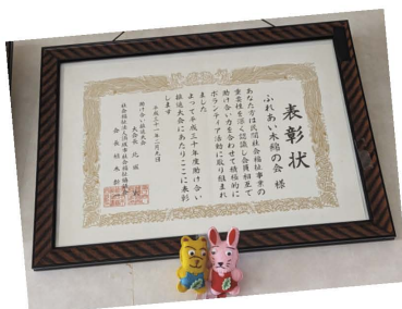
平成30年度推進大会で 表彰されました