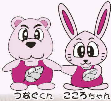
つなぐくん こころちゃん