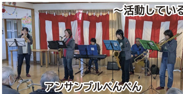
～活動しているグループ紹介～

レクリエーションの時間（30分程度）、ご自分の好きなこと！得意なこと！日頃の成果をご披露してみませんか。演奏、踊りなど、ご利用者さんと一緒に楽しめる方々、大歓迎！