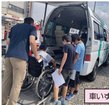
車いすリフト車体験

9/8(日)蔵の町スクウェア、botalにて行われた「わーくわくすざか」(須坂商工会議所青年部主催)に出店参加!! 沢山のみなさんに体験していただき、社協のお仕事の事を知っていただく機会になりました!!