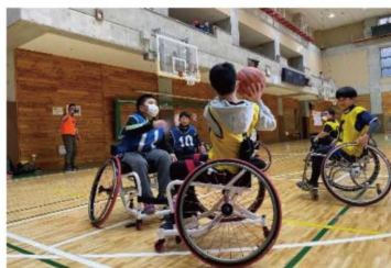
車いすバスケット

違いや個性を認め合って生活する。障がいのある人もない人もみんなが楽しめる。ともに相手の視点に立って物事を考える事が大切。自分の幸せもみんなの幸せも、同じように尊重し実現に向けていく。