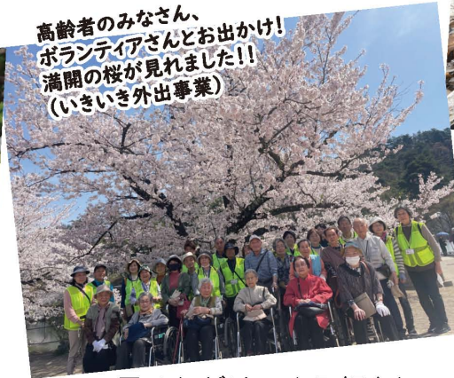
高齢者のみなさん、ボランティアさんとお出かけ！ 満開の桜が見れました！！ (いきいき外出事業)