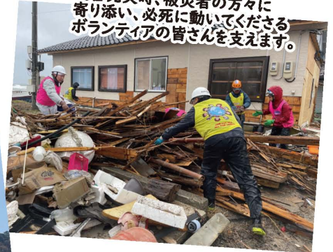
災害発災時、被災者の方々に寄り添い、必死に動いてくださるボランティアの皆さんを支えます。

高齢者、障がい者、子どもたち、災害発災時… 地域の皆様からご協力いただいた、 あたたかな気持ち は、多くの方のもとへ届いています(*^^*)