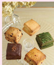
人気のクリームチーズサンドと焼き立て日替わりスコーン