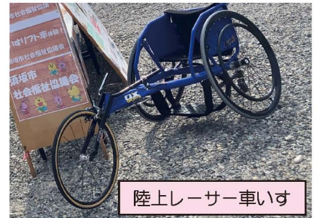
陸上レーサー車いす