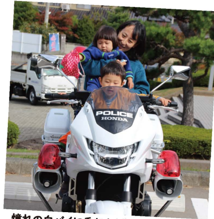
憧れの白バイに乗れた！(ふれあい広場) めちゃくちゃ、かっこいいですっ☆

赤い羽根共同募金は、毎年10月1日より募金運動がはじまり、多くの地域の皆さんにご協力いただいております。 今回は、集まった募金が、どんなところで活用されているのか！その一部をご紹介します！