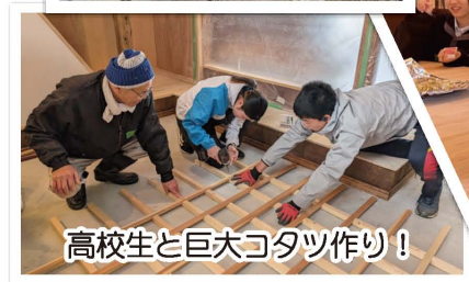
高校生と巨大コタツ作り!