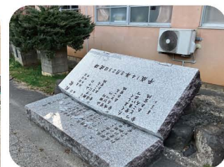
宿泊施設で倒れていた石碑…

被災地での炊き出しは初めてでしたが、みんなで協力し合い、人数分滞りなく配布できました。 まだまだ大変な時期が続くと思いますが、引き続き支援を行っていきます！ 日赤長野県支部須坂市地区では、義援金も募集中。ご協力よろしくお願ひいたします。