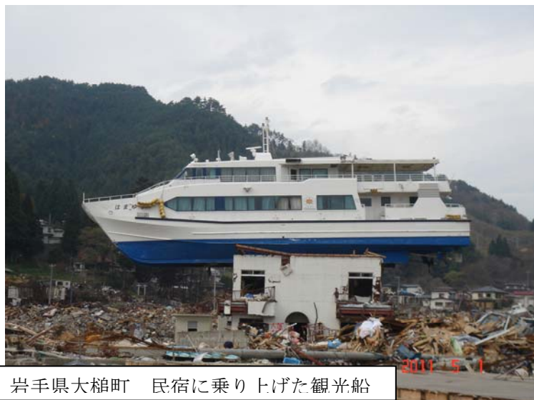
岩手県大槌町 民宿に乗り上げた観光船