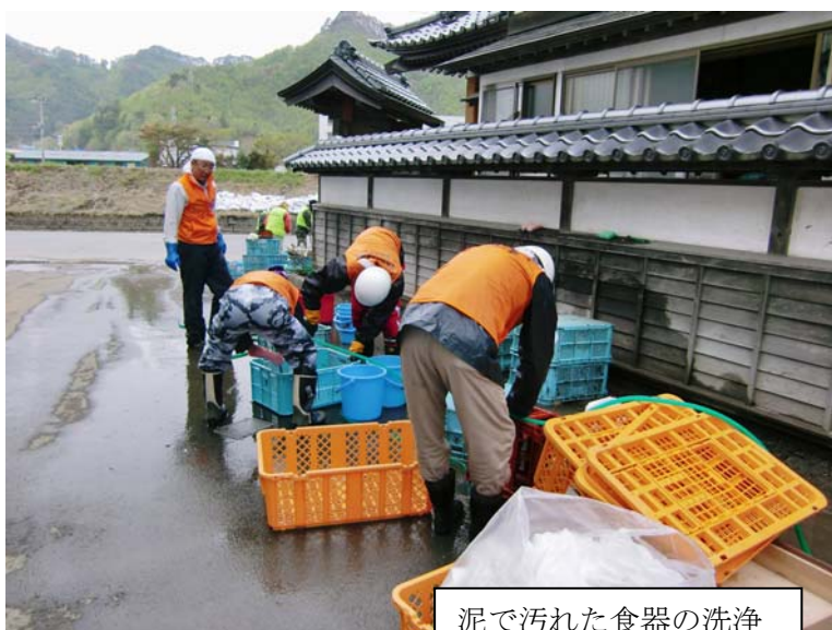
泥で汚れた食器の洗浄

みなさんも節電や節水などできることをして、みんなで東北地方や栄村を応援していきましょう！！