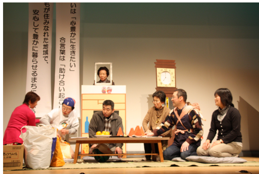
「助け合い推進大会」では、「笑いあり、涙ありの助け合いを題材とした寸劇表彰もありました。