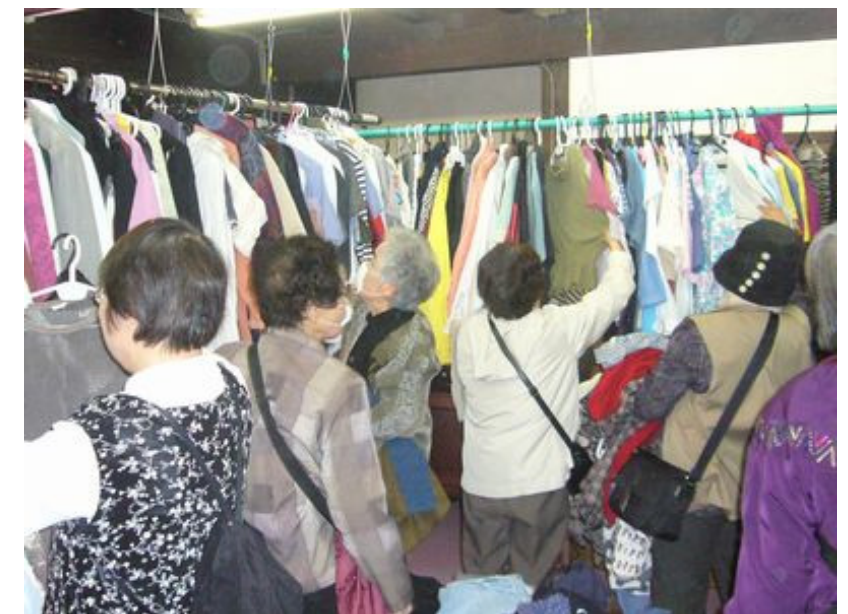
すずか助け合い推進センターを中心に春と秋に実施していますセンターバザーの様子。